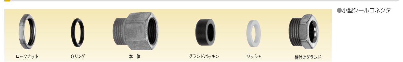
●小型シールコネクタ