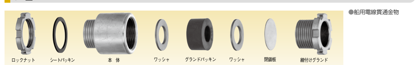
●船用電線貫通金物