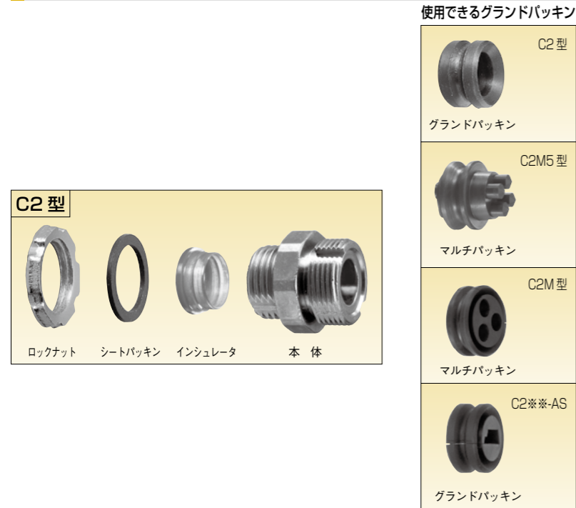
使用できるグラントパッキン